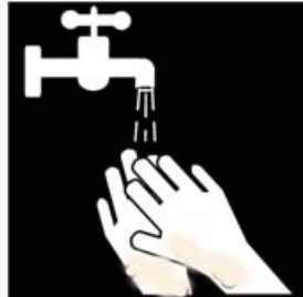
Handen nat maken