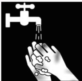
Afspoelen met water