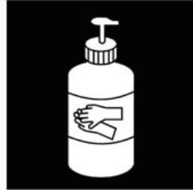
Met zeep handen wassen