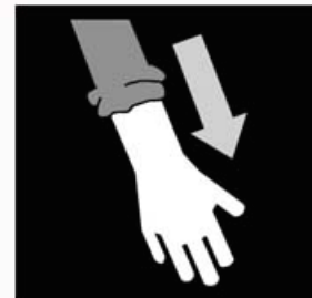
Mouw weer omlaag